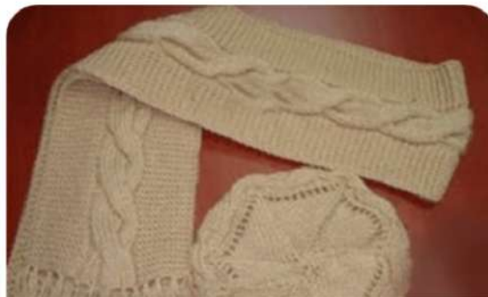
کلاه ۶ ضلعی گیس بافت

۱۰۰ گرم کاموا یا ضخامت متوسط - میل شماره ۴.۵، ۵۸ دانه سر انداخته و ۶ دانه اول را رکن - ۲۰ دانه بعدرا ساده بافی - ۶ دانه رکن و ۲۰ دانه ساده بافی - ۶ دانه رکن تا ۷ رج ببافید. رج ۸ - ۶ دانه اول را بافته ۲۰ دانه دوم را کور کنید. ۶ دانه بعد را بافته و ۲۰ دانه دوم را کور کنید و ۶ دانه اخر را رکن ببافید. رج ۹ - ۶ دانه اول را رکن بافته و ۲۰ دانه زوی میل سوار کنید تکرار از اول رج بافت را از رج ۹ تا ۱۹ ادامه دهید. تا زمانی که به اندازه دور سر شود. حال بافت با دست صورت می گیرد. بدین نحو که نوار اول را حلقه کرده و نوار دوم را از داخلش عبور دهید. تا بالا برای بافت بالای کلاه از قسمت بالا دانه می گیریم. و هفت رج ساده ببافید. رج ۸ - هر ۱۰ دانه یک دانه کور کنید. رج ۹ و همه رج های فرد دانه ها همانطور که دیده می شوند بافته شوند. رج ۱۰ - هر ۸ دانه یک دانه کور شود. رج ۱۲ هر ۶ دانه یکی کور شود. بقیه دانه ها یک جا کور شود. قسمت بالای کلاه را به شکل زیر بدوزید. از قسمت پایین بافت هم دانه گرفته و کشبافت دوتا رو دوتا زیر ببافید. شال این مدل هم اندازه گیری دانه ها شبیه کلاه می باشد.